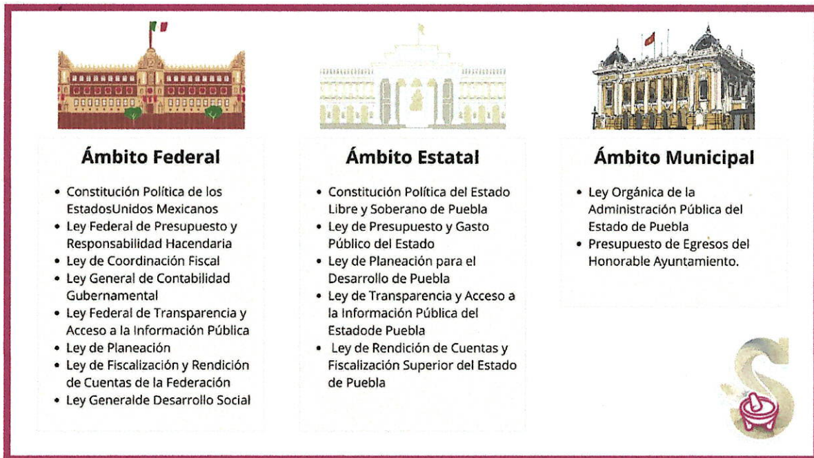
Figura 1. Ámbitos Jurídicos.

El presente Sistema de Evaluación de Desempeño es emitido con fundamento tres ámbitos federal, estatal y municipal, tal como se muestra a continuación: