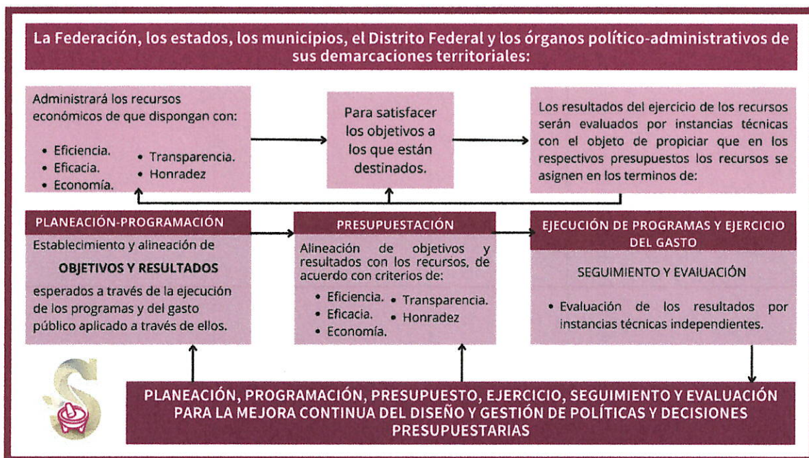
Figura 2. Contenido del artículo 134 de la CPEUM.

De forma gráfica se puede explicar el contenido de este artículo de la siguiente manera: