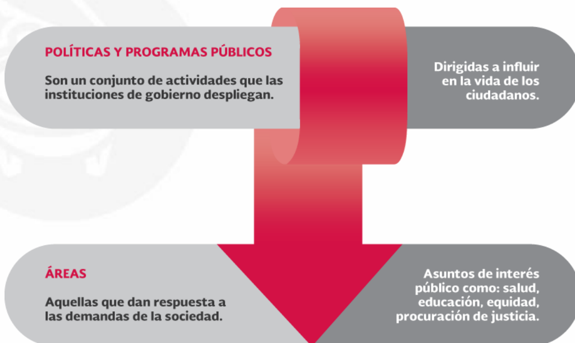
Figura número 1. Esquema de políticas y programas

Cabe acotar que, mientras la política establece en un nivel superior las pautas de la acción del gobierno, los programas públicos son el instrumento por medio del cual se ponen en práctica, tal como se muestra en la siguiente gráfica: